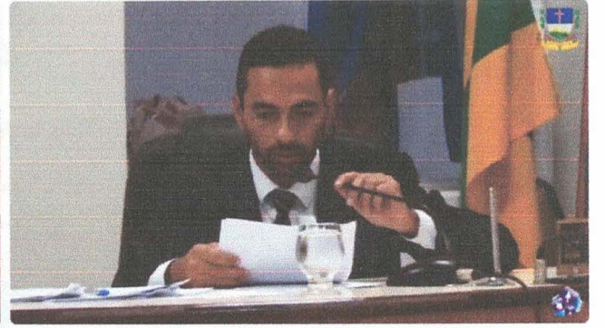
10ª Sessão Extra Ordinária do Poder Legislativo de São Domingos Sergipe - 06-12-2023