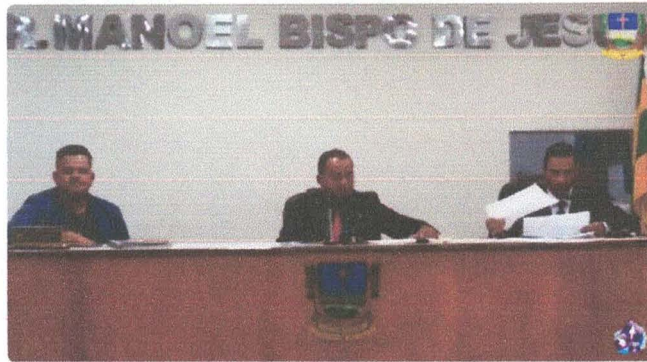
10ª Sessão Extra Ordinária do Poder Legislativo de São Domingos Sergipe - 06-12-2023