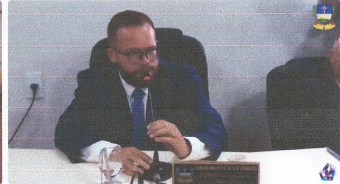
72ª Sessão Ordinária do Poder Legislativo de São Domingos Sergipe - 12-12-2023