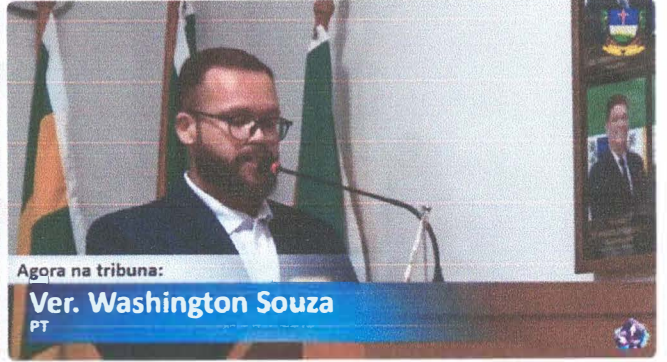
71ª Sessão Ordinária do Poder Legislativo de São Domingos Sergipe - 06-12-2023