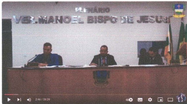
53ª Sessão Ordinária do Poder Legislativo de São Domingos Sergipe - 03-10-2023