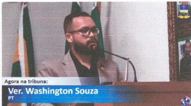
53ª Sessão Ordinária do Poder Legislativo de São Domingos Sergipe - 03-10-2023