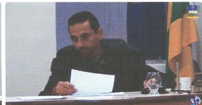
4ª Sessão Extra Ordinária do Poder Legislativo de São Domingos Sergipe - 13-12-2023