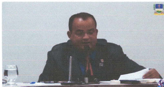
4ª Sessão Extra Ordinária do Poder Legislativo de São Domingos Sergipe - 13-12-2023