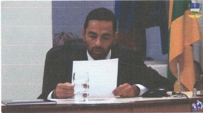
71ª Sessão Ordinária do Poder Legislativo de São Domingos Sergipe - 06-12-2023