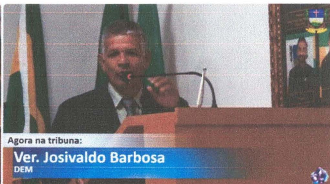
55ª Sessão Ordinária do Poder Legislativo de São Domingos Sergipe - 10-10-2023