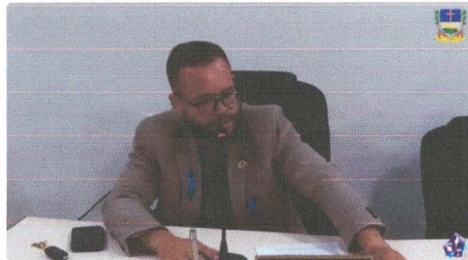
65ª Sessão Ordinária do Poder Legislativo de São Domingos Sergipe - 14-11-2023