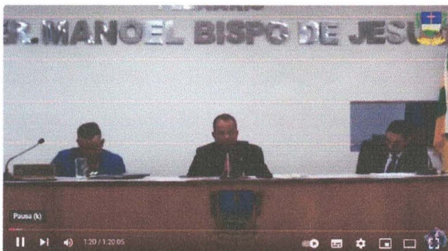
55ª Sessão Ordinária do Poder Legislativo de São Domingos Sergipe - 10-10-2023