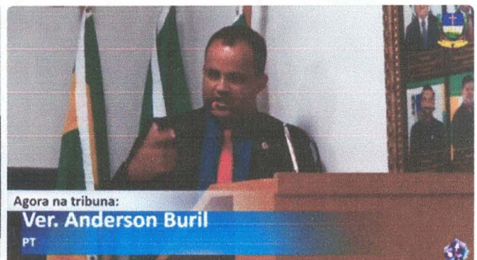
65ª Sessão Ordinária do Poder Legislativo de São Domingos Sergipe - 14-11-2023