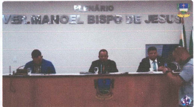
65ª Sessão Ordinária do Poder Legislativo de São Domingos Sergipe - 14-11-2023