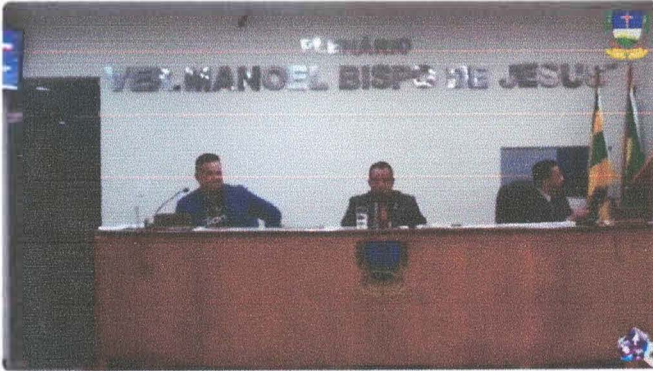
70ª Sessão Ordinária do Poder Legislativo de São Domingos Sergipe - 05-12-2023

Handwritten signature or initials in blue ink.