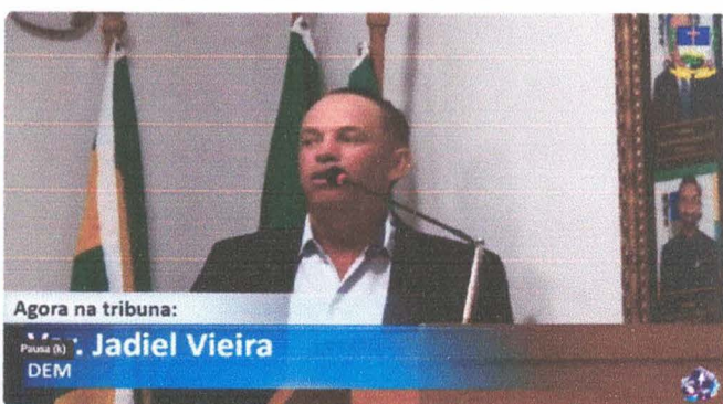
58ª Sessão Ordinária do Poder Legislativo de São Domingos Sergipe - 18-10-2023