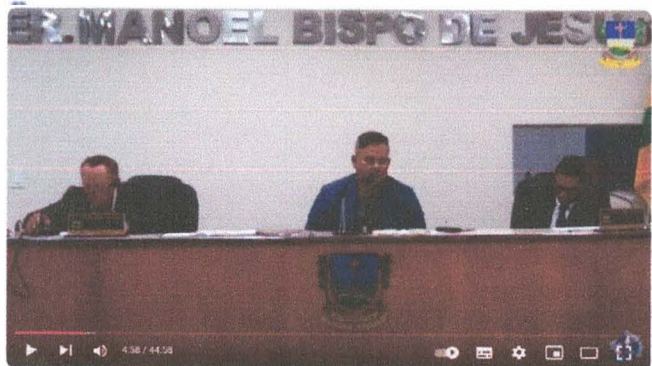
58ª Sessão Ordinária do Poder Legislativo de São Domingos Sergipe - 18-10-2023