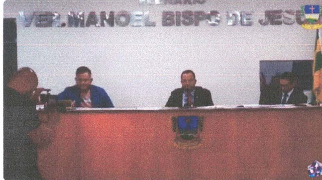
72ª Sessão Ordinária do Poder Legislativo de São Domingos Sergipe - 12-12-2023