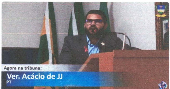
60ª Sessão Ordinária do Poder Legislativo de São Domingos Sergipe - 25-10-2023