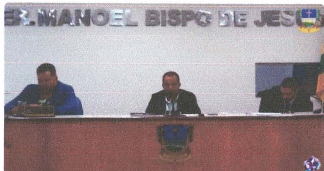
60ª Sessão Ordinária do Poder Legislativo de São Domingos Sergipe - 25-10-2023