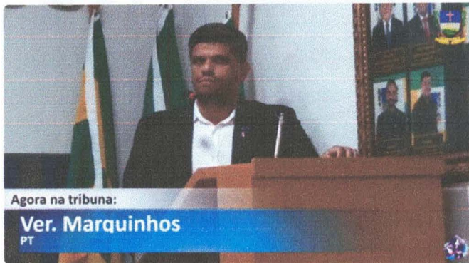
62ª Sessão Ordinária do Poder Legislativo de São Domingos Sergipe - 01-11-2023