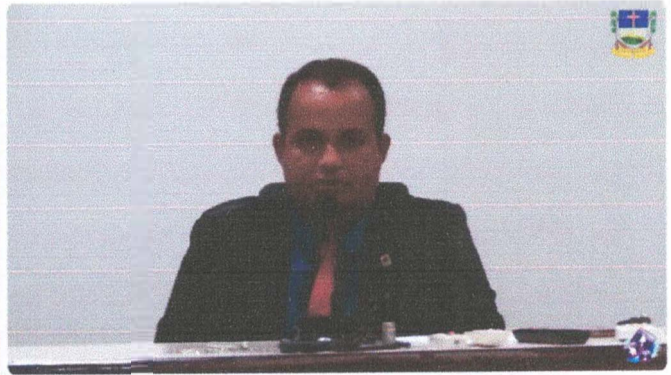
62ª Sessão Ordinária do Poder Legislativo de São Domingos Sergipe - 01-11-2023