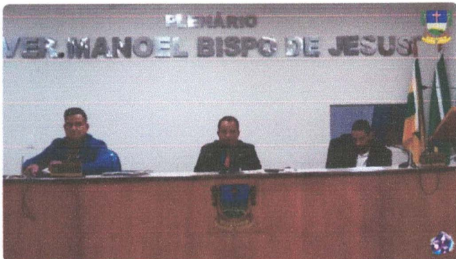
62ª Sessão Ordinária do Poder Legislativo de São Domingos Sergipe - 01-11-2023