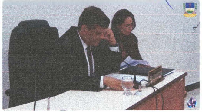
70ª Sessão Ordinária do Poder Legislativo de São Domingos Sergipe - 05-12-2023