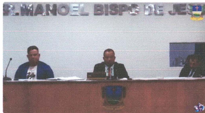
68ª Sessão Ordinária do Poder Legislativo de São Domingos Sergipe - 28-11-2023