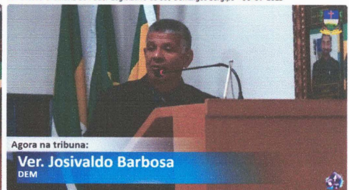
44ª Sessão Ordinária do Poder Legislativo de São Domingos Sergipe - 30-08-2023