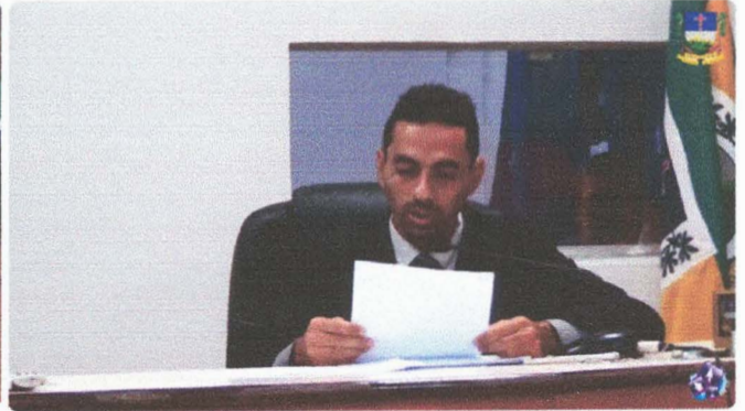
48ª Sessão Ordinária do Poder Legislativo de São Domingos Sergipe - 13-09-2023