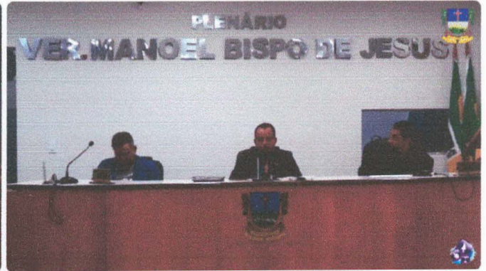
42ª Sessão Ordinária do Poder Legislativo de São Domingos Sergipe - 23-08-2023