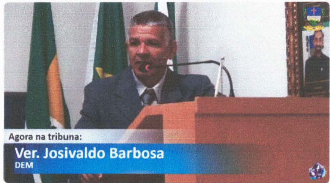
49ª Sessão Ordinária do Poder Legislativo de São Domingos Sergipe - 19-09-2023