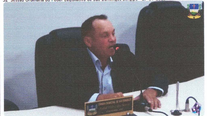
52ª Sessão Ordinária do Poder Legislativo de São Domingos Sergipe - 27-09-2023