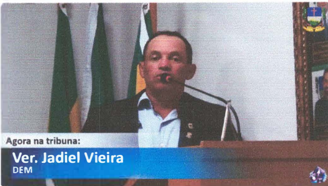
38ª Sessão Ordinária do Poder Legislativo de São Domingos Sergipe - 09-08-2023