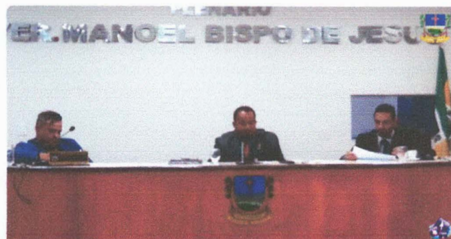
1ª Sessão Extra Ordinária do Poder Legislativo de São Domingos Sergipe - 20-09-2023