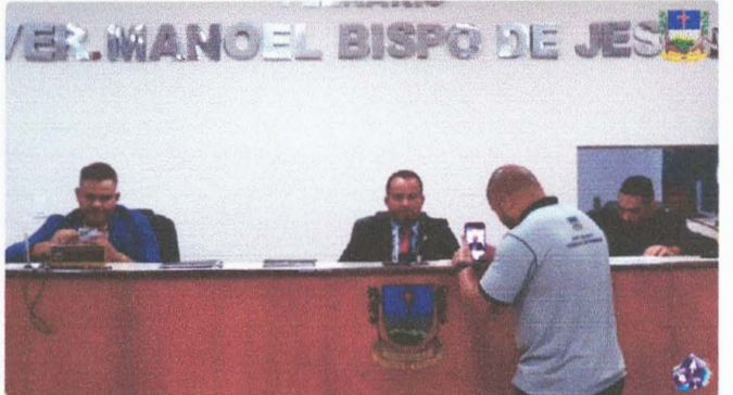
49ª Sessão Ordinária do Poder Legislativo de São Domingos Sergipe - 19-09-2023