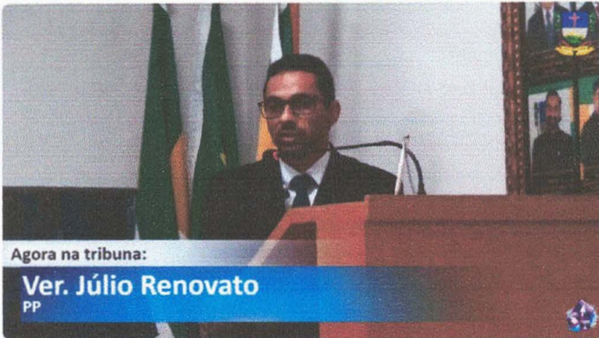
41ª Sessão Ordinária do Poder Legislativo de São Domingos Sergipe - 22-08-2023