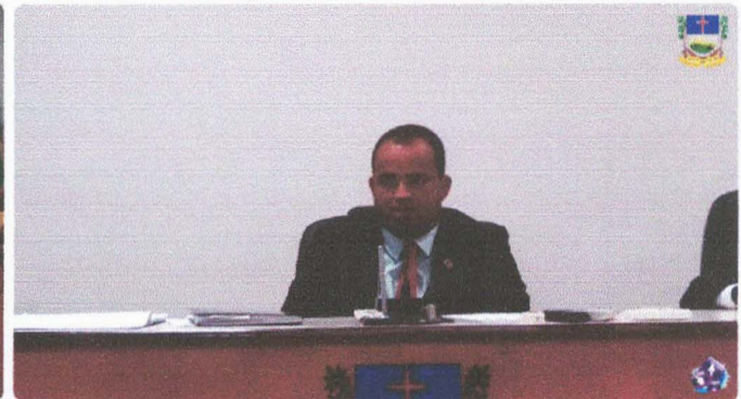
44ª Sessão Ordinária do Poder Legislativo de São Domingos Sergipe - 06-09-2023