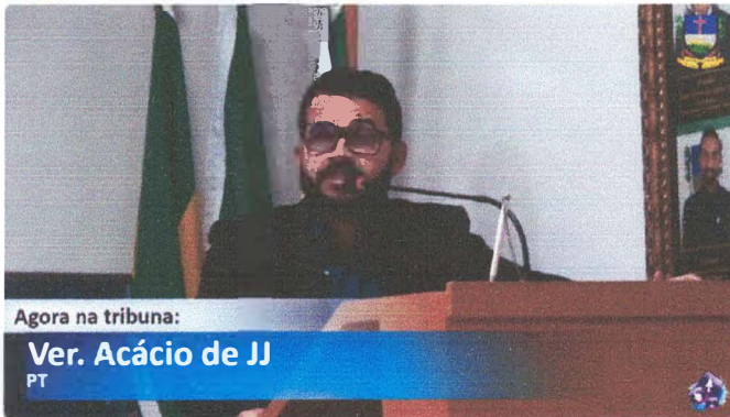
36ª Sessão Ordinária do Poder Legislativo de São Domingos Sergipe - 09-08-2023