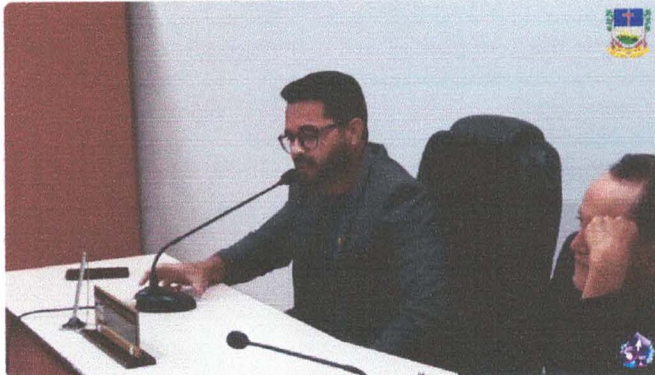
52ª Sessão Ordinária do Poder Legislativo de São Domingos Sergipe - 27-09-2023