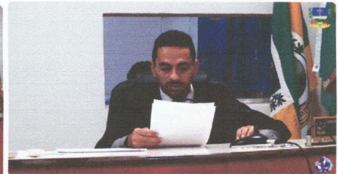
2ª Sessão Extra Ordinária do Poder Legislativo de São Domingos Sergipe - 20-09-2023

Handwritten signature or initials in blue ink.