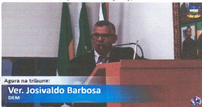
40ª Sessão Ordinária do Poder Legislativo de São Domingos Sergipe - 15-08-2023