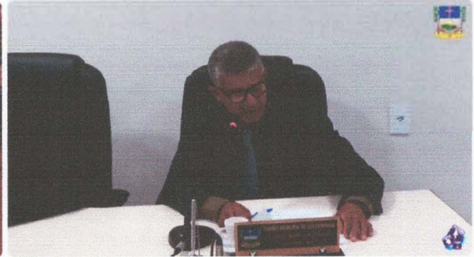
41ª Sessão Ordinária do Poder Legislativo de São Domingos Sergipe - 22-08-2023