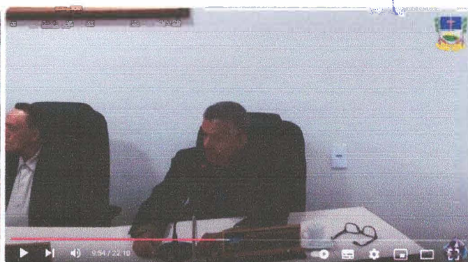
37ª Sessão Ordinária do Poder Legislativo de São Domingos Sergipe - 02-08-2023