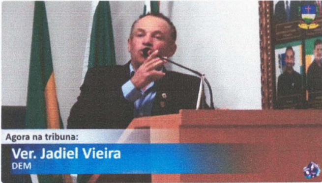
48ª Sessão Ordinária do Poder Legislativo de São Domingos Sergipe - 13-09-2023