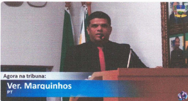
46ª Sessão Ordinária do Poder Legislativo de São Domingos Sergipe - 06-09-2023