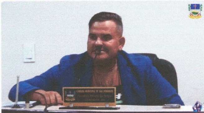
48ª Sessão Ordinária do Poder Legislativo de São Domingos Sergipe - 13-09-2023