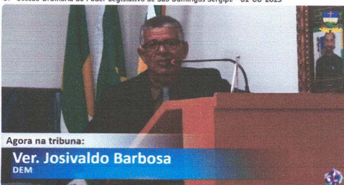
37ª Sessão Ordinária do Poder Legislativo de São Domingos Sergipe - 02-08-2023