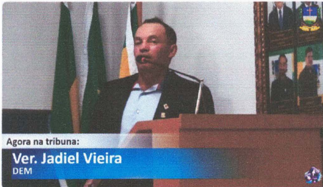
42ª Sessão Ordinária do Poder Legislativo de São Domingos Sergipe - 23-08-2023