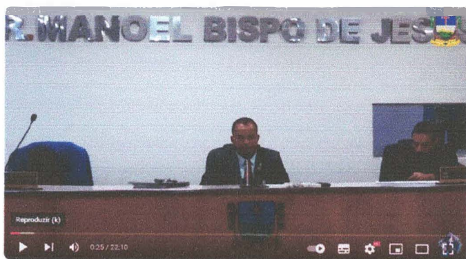
37ª Sessão Ordinária do Poder Legislativo de São Domingos Sergipe - 02-08-2023