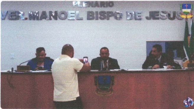
44ª Sessão Ordinária do Poder Legislativo de São Domingos Sergipe - 30-08-2023