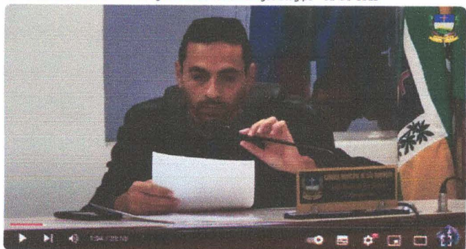
37ª Sessão Ordinária do Poder Legislativo de São Domingos Sergipe - 02-08-2023