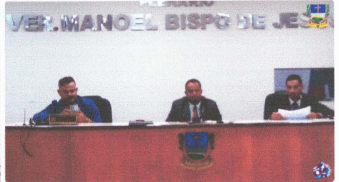
48ª Sessão Ordinária do Poder Legislativo de São Domingos Sergipe - 13-09-2023