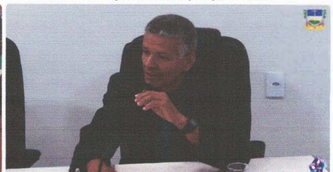
46ª Sessão Ordinária do Poder Legislativo de São Domingos Sergipe - 06-09-2023