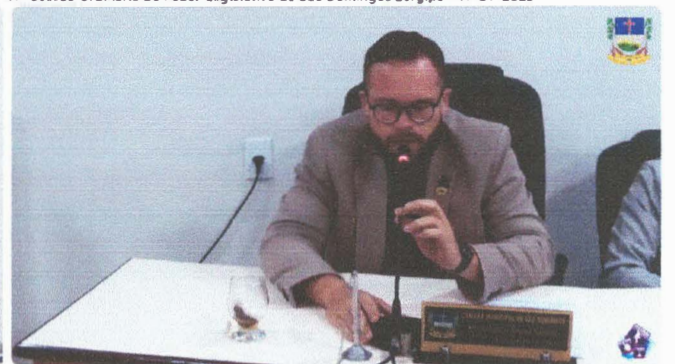
49ª Sessão Ordinária do Poder Legislativo de São Domingos Sergipe - 19-09-2023