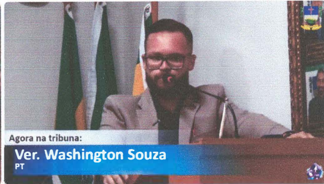
38ª Sessão Ordinária do Poder Legislativo de São Domingos Sergipe - 09-08-2023