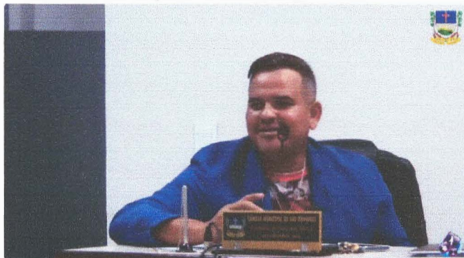
49ª Sessão Ordinária do Poder Legislativo de São Domingos Sergipe - 19-09-2023