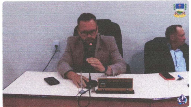
52ª Sessão Ordinária do Poder Legislativo de São Domingos Sergipe - 27-09-2023